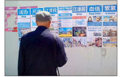
大陆街头的“法办江泽民”招贴

据明慧网 2017 年 5 月 5 日报导，大陆一些公检法人员明白真相后，不再参与迫害法轮功。山东青岛一起构陷法轮功学员的案件，转到即墨检察院后，多次被退回公安机关，公安机关换个罪名又诉至即墨法院。后因即墨法院法官对此案全体回避，该构陷案被青岛市中院指定移交到平度检察院。