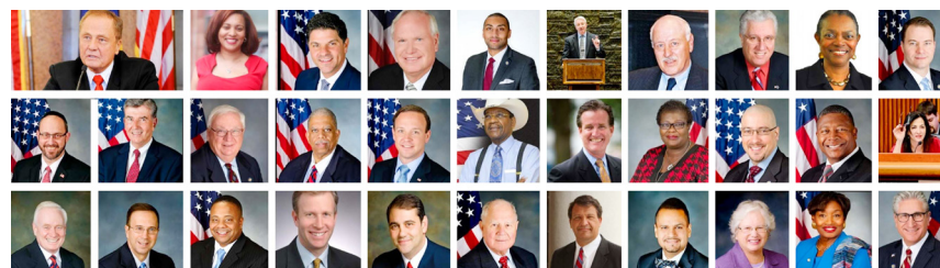
决议案由纽约州参议员约翰·博纳西奇发起，31 名参议员共同提议。