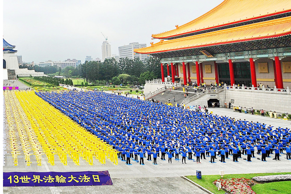
5 月 13 日是法轮大法日，全球法轮功学员每年都举行庆祝活动，图为台湾。

当 15 岁的徐鑫洋拿出两张她爸爸徐大为的照片时，研讨会现场几乎所有人都落泪了。徐大为曾是一个健康英俊的青年，遭受迫害后，他骨瘦如柴，遍体鳞伤。徐鑫洋含着泪水说：“我想代表所有中国法轮功学员的孩子说一句话：我们也想有一个美好的家庭、父母的疼爱，希望大家帮助停止这场迫害，停止这场对好人的迫害。”◇