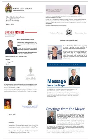
■ 加拿大政要的部分贺信

2017 年 5 月 13 日法轮大法传世 25 周年之际，北美政要纷纷发贺信，赞扬法轮大法给世界带来福祉，赞扬法轮功学员坚持实践“真善忍”的价值观，为社会做出贡献。