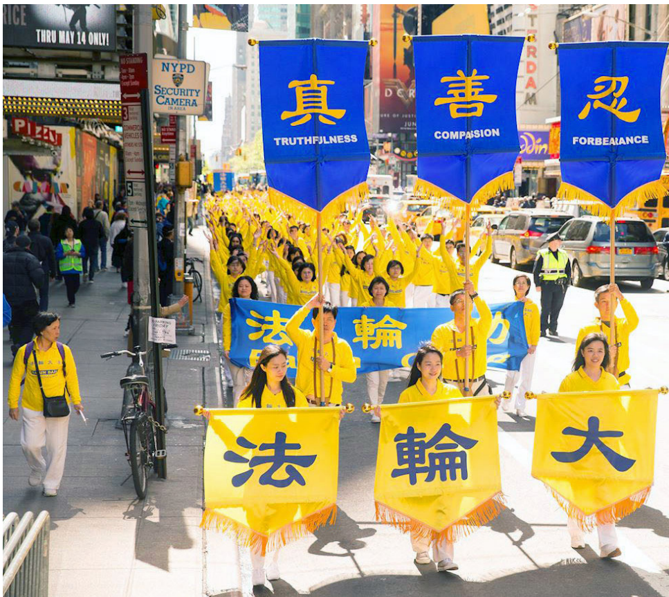
■ 2017年5月12日，近万名法轮功学员组成的游行队伍横贯纽约曼哈顿。