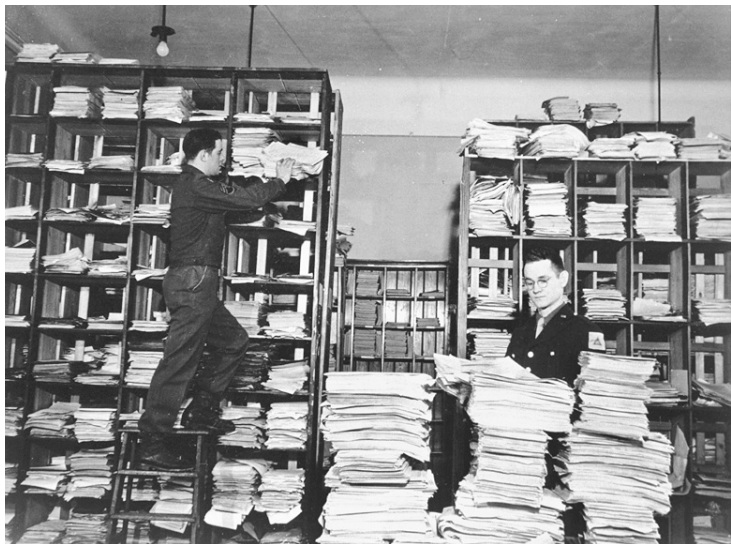
纽伦堡审判时期，工作人员在甄选大量的德语文件，这些文件由调查员收集。昔日的上级指令与层层执行者的签名，日后成为纳粹官员们的犯罪证据。