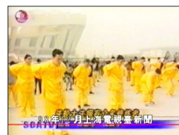
上海电视台报道法轮功受到广大群众欢迎 (1998年11月24日)

■ 2017年5月13日，一组明黄色的大字“大法洪传 25 years”呈现在纽约联合国总部对岸的甘纯公园（Gantry Plaza State Park），这是台湾、香港、韩国、越南、美国等国家和地区的1000多名法轮功学员用大型排字的方式，庆祝“5·13世界法轮大法日”，感恩李洪志先生在25年前把法轮大法传给世人。