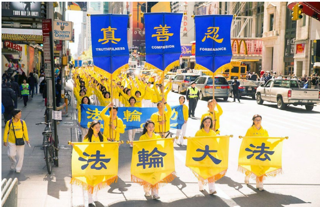
■ 2017 年 5 月 12 日，近万名法轮功学员组成的游行队伍横贯纽约曼哈顿。