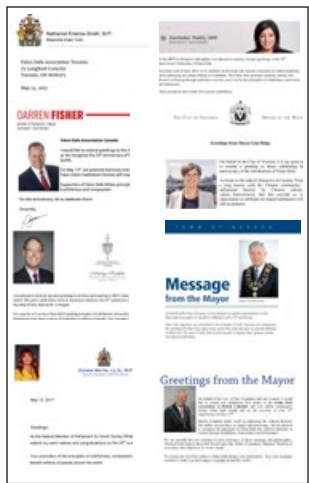
■ 加拿大政要的部分贺信

加拿大多名国会议员、省议员和市议员发出贺信恭贺法轮大法日，他们赞扬法轮大法的教导打动了无数世人的心，由衷感谢法轮功修炼者坚持不懈地与世人分享“真、善、忍”的价值观，并表示“真、善、忍”的重要性已经获得加拿大的肯定和认同。其中加拿大首都渥太华市市长吉姆·沃森连续第七年代表市议会宣布 5 月 13 日为“渥太华法轮大法日”。◇