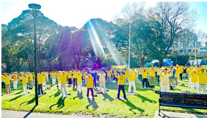
■ 澳洲悉尼市中心的贝尔莫尔公园（Belmore Park）里，法轮功学员炼功，祥和的能量场和美妙的炼功音乐，吸引路人驻足观看和学功。