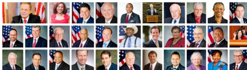
■ 决议案由纽约州参议员约翰·博纳西奇发起，31 名参议员共同提议。