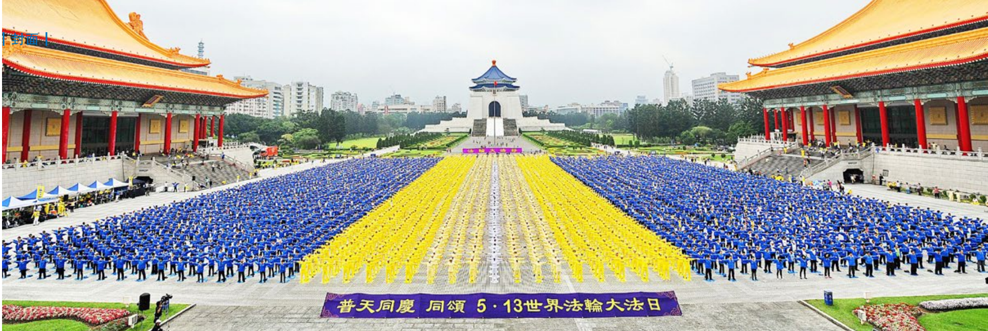
■ 5月13日是法轮大法日，全球法轮功学员每年都举行庆祝活动，图为台湾。