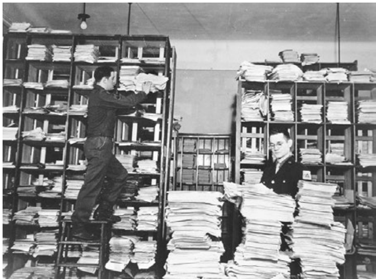
纽伦堡审判时期，工作人员在甄选大量的德语文件，这些文件由调查员收集。昔日的上级指令与层层执行者的签名，日后成为纳粹官员们的犯罪证据。