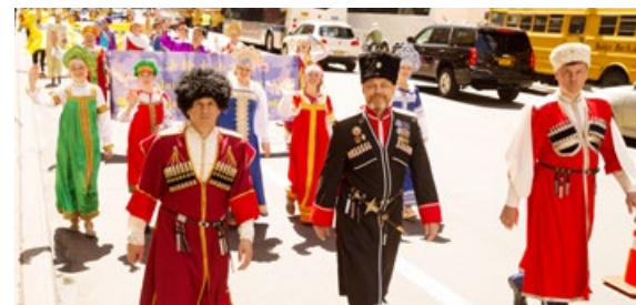
■ 身穿节日盛装的各族裔法轮功学员