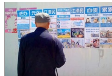
大陆街头的“法办江泽民”招贴

据明慧网 2017 年 5 月 5 日报导，大陆一些公检法人员明白真相后，不再参与迫害法轮功。山东青岛一起构陷法轮功学员的案件，转到即墨检察院后，多次被退回公安机关，公安机关换个罪名又诉至即墨法院。后因即墨法院法官对此案全体回避，该构陷案被青岛市中院指定移交到平度检察院。