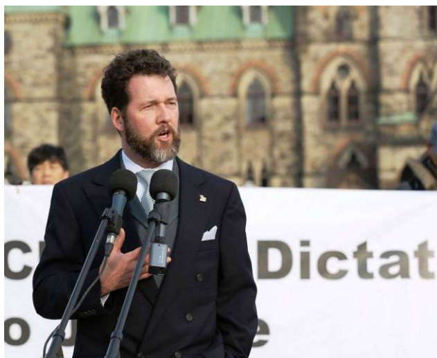
■ 加拿大国会议员 Scott Reid

【明慧网】法轮大法（又称法轮功）弘传二十五周年之际，加拿大法轮大法学会接到国会议员 Scott Reid 的贺信。Reid 议员在贺信中表示自己全力支持和声援法轮大法。