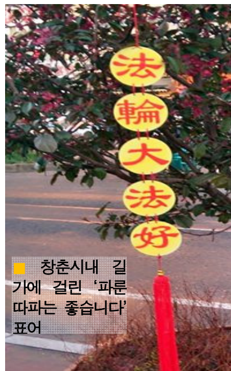
■ 창춘시내 길가에 걸린 '파룬따파는 좋습니다' 표어

2017 년 5 월 8 일, 훈춘 파룬궁수련생 왕샤오민(王曉敏)은 친척방문을 떠났다가 더후이(德惠)서쪽 역전에서 철로 파출소 경찰한테 납치됐다. 소식에 따르면 그녀가 엔지 고속철역에서 표를 살 때 국가안전 연선의 경보가 울려 집적 그의 신분정보를 각 연선 정거장에 통지해 차에서 내릴 때 중점으로 검사했다고 한다.