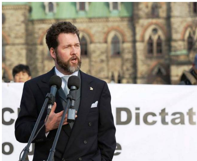
■ 加拿大国会议员 Scott Reid

【明慧网】法轮大法（又称法轮功）弘传二十五周年之际，加拿大法轮大法学会接到国会议员 Scott Reid 的贺信。Reid 议员在贺信中表示自己全力支持和声援法轮大法。