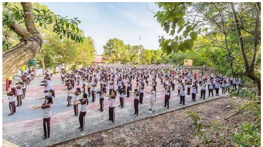
↑ 特拉丹第一中学千人集体学炼法轮功

两次介绍会除了向老师和学生展示法轮功功法外，学员们还分享了自己在实修中心性升华的美好，并讲述了法轮大法在中国大陆无辜遭受迫害的情况。