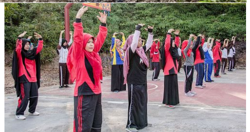
⇨ 卡尔蒂尼高中师生学炼法轮功五套功法

红墙摇摇坠，莫站危墙边。退党、退团、退队（三退）顺天意，神佑得平安。心铭大法好，步入新纪元。