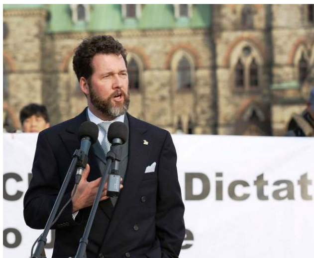
■ 加拿大国会议员 Scott Reid

【明慧网】法轮大法（又称法轮功）弘传二十五周年之际，加拿大法轮大法学会接到国会议员 Scott Reid 的贺信。Reid 议员在贺信中表示自己全力支持和声援法轮大法。