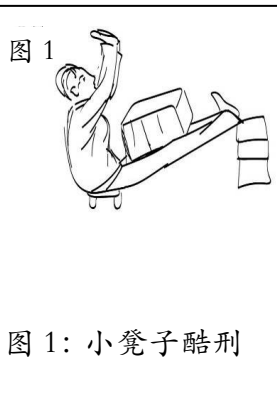
图 1: 小凳子酷刑

庄虾昌因合法信仰已经多次遭受迫害。2002年5月8日，庄虾昌被汕尾市城区“610”国安、国保警察非法绑架，之后警察何惠雄、李子群、苏峥嵘、任某等十多人窜到庄虾昌家，非法抄家，抢走了一辆摩托车，不甘心，当天夜晚，趁庄虾昌的儿子、妻子不注意，先放迷魂药，再一次抄家，第二天庄虾昌的家人醒来