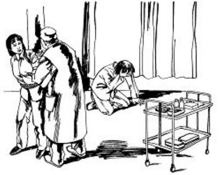
中共酷刑示意图：注射药物 个月的迫害我面色黑瘦。

二零零五年七月专门培训七十多人做“转化”迫害：冬天拉出去冻，关小号，送病号监区，坐小凳（长达十五个小时臀部坐烂），折磨，殴打，不让睡觉、洗澡、换衣服，用针扎，用脏袜子捂嘴、用牙签往手指甲盖里扎，打乳房、阴处，上大挂，死人床等。