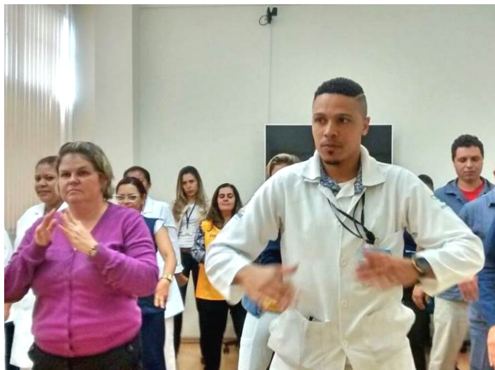
■ 巴西圣保罗市 Presidente 医院的员工们学炼法轮功的第三套功法——贯通两极法

此次活动的组织者对法轮功学员表示深深的感谢，并希望他们每周光临该医院，让更多的工作人员认识法轮功。◇