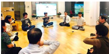
■ 新入门的学员在韩国首尔天梯书店学炼法轮功