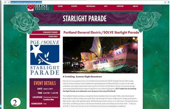
图 1：花车的“法船”设计以其优美、气势、以及祥和音乐伴随的功法展示，再次获得游行最高奖项