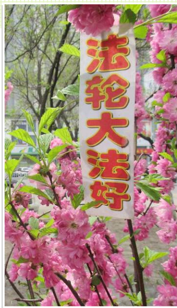
吉林省吉林市街头鲜花丛中的“法轮大法好”标语。（2017年5月）