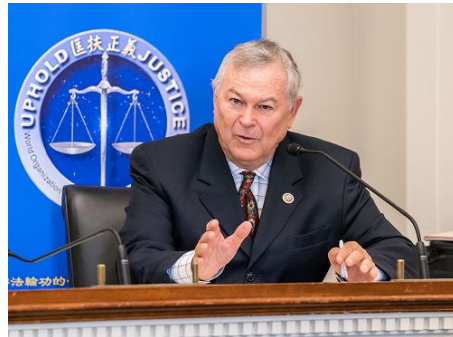
图：美国国会众议员罗拉巴克