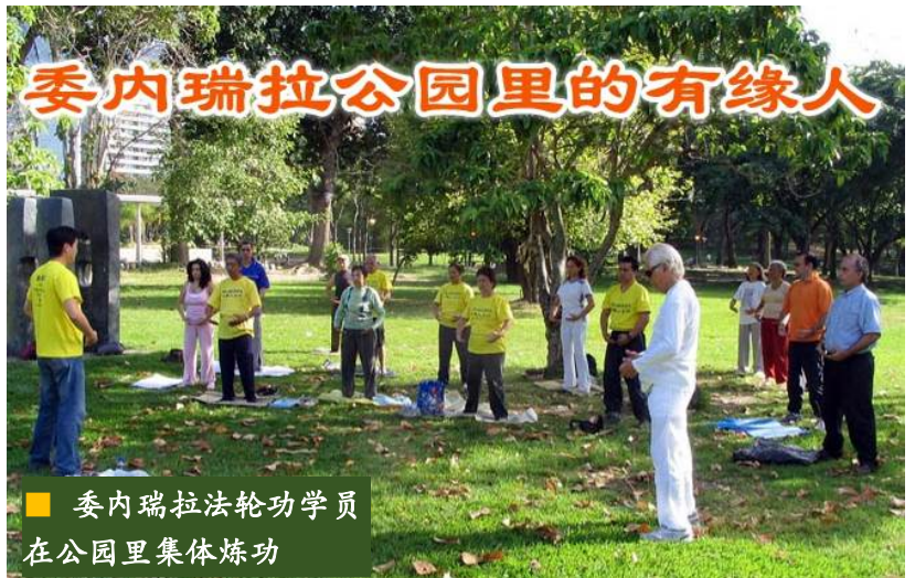
■ 委内瑞拉法轮功学员在公园里集体炼功

对我身上发生的变化，我无法相信，也无法理解。我到公园前和离开公园后，简直判若两人。我太高兴了，我变得焕然一新，充满乐观！