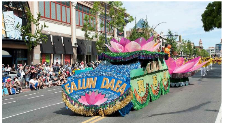
■ 精美的莲花花车赢得观众的由衷赞美，人们纷纷拍照留念。