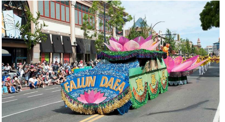
■ 精美的莲花花车赢得观众的由衷赞美，人们纷纷拍照留念。