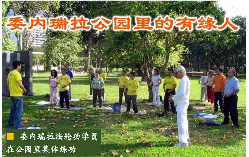
■ 委内瑞拉法轮功学员在公园里集体炼功

对我身上发生的变化，我无法相信，也无法理解。我到公园前和离开公园后，简直判若两人。我太高兴了，我变得焕然一新，充满乐观！