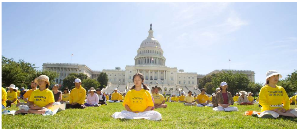
来自世界各地的部份法轮功学员在美国白宫前集会，要求中共立即停止对法轮功的迫害。（2011 年 7 月 14 日）

自 1999 年 7 月以来，中共迫害法轮功是目前中国的最大人权灾难，迫害祸及整个社会。据明慧网的不完