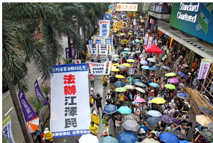
■ 2017年7月1日，香港民众大游行中的“法办江泽民”巨型条幅。

看到法轮功学员的游行队伍，深圳居民张先生感叹：“法轮功学员无论走在哪里，都是一道和平亮丽的风景。我每次来香港，看到法轮功（学员）总是静静地站在一旁，向各人群传递真相、告知真相，在那里和平地静坐，并不像中共宣传的那样。香港的民主自由，法轮功学员功不可没，他们在维护自身权益的同时，也在促进香港