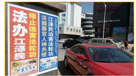
▲图：辽宁铁岭市街头的标语

我多次被中共迫害，给我和家人精神上、经济、名誉上造成极大的伤害。被警察勒索和抢劫钱物，知道的是13800元钱，银行卡钱数不详了。做买卖的钱没有了，商店卖服装的两个床子也没钱上货黄了，很长一段时间我们家生活非常困难，我为了度日，骑自行车卖过面条、豆腐脑，打过零工，做过苦力。妻子和孩子也因为我遭迫害而受到惊吓，每到敏感日她们都非常害怕，我妻子一听到警车叫，吓得心怦怦跳、睡不着觉。◇