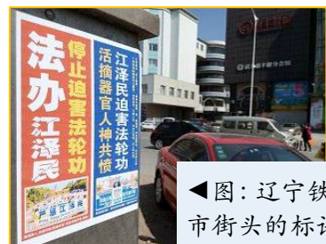
◀图：辽宁铁岭市街头的标语

【明慧网】现在，大陆越来越多的公检法司人员明白了法轮功真相，他们开始真正地为自己的生命和未来考虑。他们顺应现政权的新政，不再执行江泽民集团的迫害政策，用实际行动不再做违法的事，法院、检察院、公安机关无罪释放法轮功学员的案例越来越多。这些公检法人员主动抵制、回避上级迫害指令保护法轮功学员，有的检察院撤诉、免于起诉，直接释放法轮功学员。