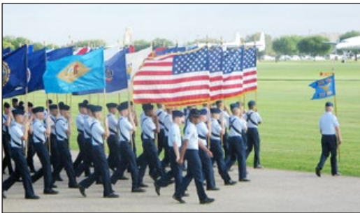
美军空军基本训练营毕业典礼

我的右腿在襁褓中时被炭火烧过，五六岁时被马车砸过，后来还被狗咬过，现在膝盖又痛。但是我想，这些都不可以阻挡我要走的路。军营餐厅的每张桌子上，有不同的座右铭。我看