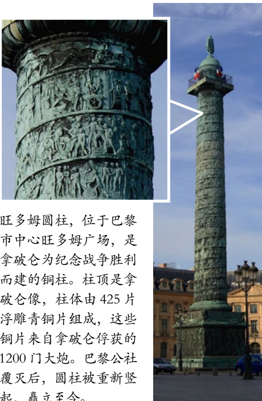
旺多姆圆柱，位于巴黎市中心旺多姆广场，是拿破仑为纪念战争胜利而建的铜柱。柱顶是拿破仑像，柱体由425片浮雕青铜片组成，这些铜片来自拿破仑俘获的1200门大炮。巴黎公社覆灭后，圆柱被重新竖起，矗立至今。