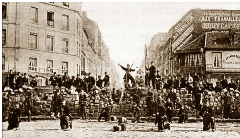
1871年3月18日，巴黎公社在巴黎城内设置的路障。