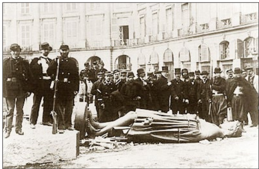
巴黎公社于1871年5月摧毁了纪念拿破仑胜利的旺多姆圆柱，柱顶的拿破仑塑像也被毁。

当时身居巴黎的人们都见证了，巴黎公社社员是破坏成性的一群流寇，他们实行报禁，把给国王宣讲的达尔布瓦大主教抓作人质枪毙，暴杀教士，摧毁名胜古迹，以此为快事。