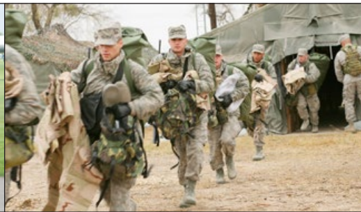
新兵参加空军基本训练 (Wikipedia)