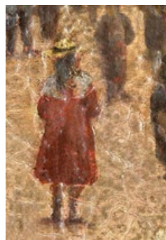
印象派油画《布里昂松市大雨漏街的活跃街景》局部。此画作于 1870 年左右，作者不详。画面因技法不合理已经严重变色开裂。