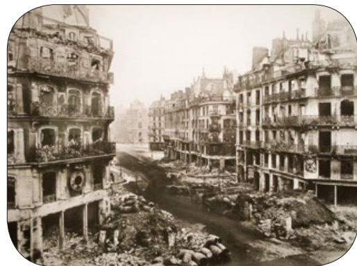
法国首都巴黎，富丽甲天下。巴黎公社暴乱过后，华美的楼台化为灰土。