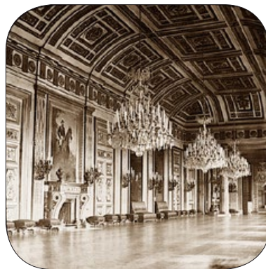
法国皇宫——杜伊勒里宫一角。整个宫殿被巴黎公社焚毁。

1871年5月，暴乱的巴黎公社遭到法国政府军队的打击，5月28日，巴黎公社在巴黎城内设置的最后一个路障被政府军