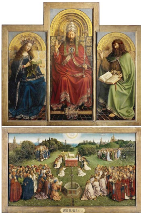
凡·艾克 (Van Eyck) 兄弟的《根特祭坛画—神秘的羔羊》(局部)。整幅祭坛画约 343×440 厘米，作于 1415 年～1432 年，题材取自圣经《启示录》，表达了对神在末世时慈悲救众生的赞颂。画中“树脂油多层罩染技法”的出色运用与静谧精细的写实风格，让此画成为油画史上最为重要的杰作之一。

绘制这样的作品，在心境上要有足够的定力，技巧上需要长期经验的积累，材料运用上必须符合自然法则。只有如此，作品才允许保存到流芳百世。