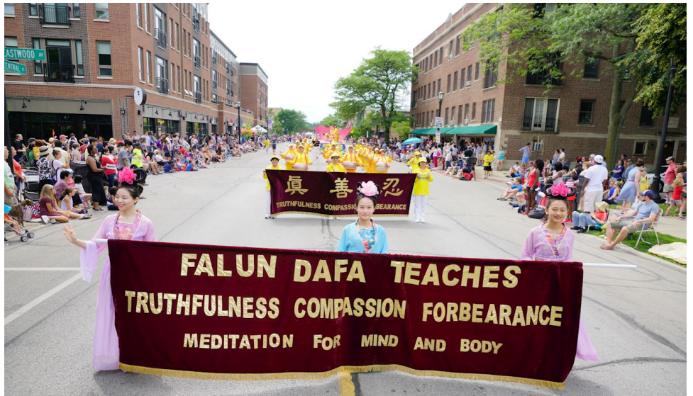
图：芝加哥法轮功学员参加 2017 年 7 月 4 日的埃文斯顿美国独立日大游行。

队伍所到之处，掌声一片。观众们热情地招手，欢呼，用手机拍照。人们纷纷从法轮功学员手中接过传单，有的向学员合十，也有人跟着学员说“法轮大法好”。有些观众已经从前些年的游行中了解了真相，在给自己的家人朋友介绍法轮功。