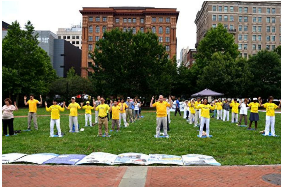
■ 2017年7月23日，费城地区部分法轮功学员在自由钟广场演示功法。

“那8年是我生命中最黑暗的日子”，她流着眼泪说：“我们每天被迫凌晨4、5点就要开始工作直到午