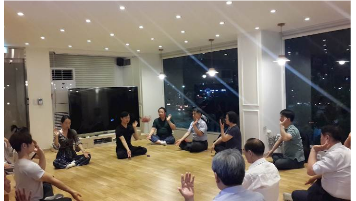
■ 在法轮功学习班上，新老学员们集体打坐炼功。

修炼之前，他在医院接受了痴呆症检查，指数高达10，修炼法轮功后，发现指数竟降为零。对此结果，医生大为震惊，并询问是什么原因引发了这样的奇迹。老先生现在痴呆症症状完全消失了，而且他的变化不止是身体方面的，他说自己以前整天都在抱怨，而现在抱怨