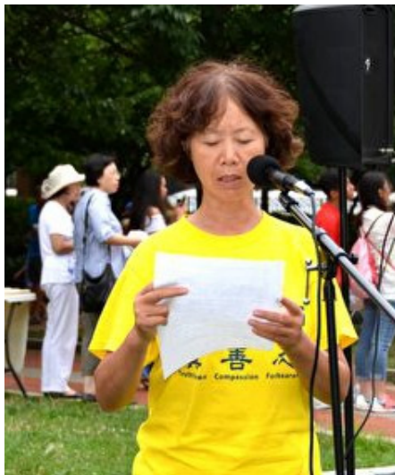
■ 来自安徽的沈女士由于修炼法轮功多次被中共当局非法关押，累计时间长达 11 年之久。

夜，凌晨 2 点才可以睡觉。我们还经常 24 小时不许睡觉，连续工作来完成沉重的工作量。我们全年只能休息 4 至 5 天。”