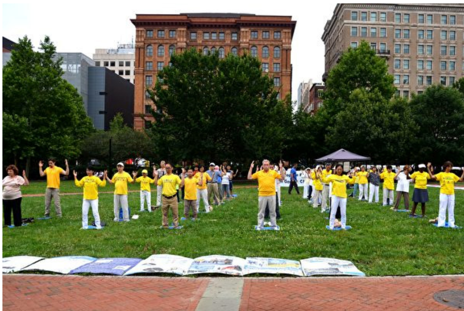
■ 2017 年 7 月 23 日，费城地区部分法轮功学员在自由钟广场演示功法。

“那 8 年是我生命中最黑暗的日子”，她流着眼泪说：“我们每天被迫凌晨 4、5 点就要开始工作直到午