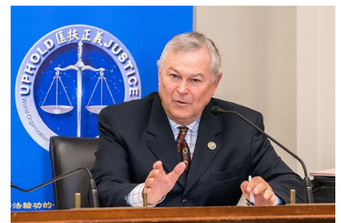
미국 하원의원 로라바커

미국 국회 외교사무위원회 중견 의원 크리스 스미스는 서면 성명에서 밝혔다. "더 이상 어떠한 핑계도 받아들이 수 없고, 우리에게 해결책이 필요합니다. 우리에게 중국과 전 세계에서 발생하고 있는 폭력을 제지하기 위해 협조와 노력이 필요합니다. 중공의 관원과 의료계에 그들의 행위에 따르는 후과를 알려야 하고, 그들에게 반드시 책임을 물어야 합니다. 양심수, 특히 파룬궁 수련생에 대한 마구잡이식 구금과 고문, 학대, 정신병 실험과 강제 장기적출