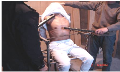
中共酷刑演示图：电棍电击

二零零一年七月的一天下午，九大队二分队的法轮功学员被带到食堂，被逼着在一个诬蔑法轮功的展板前上洗脑课。一个站在最前面的高个法轮功学员一把将展板上的图片撕下来，其他法轮功学员也去撕图片。警察恼羞成怒，命令所有撕图片的人站出来。当时有十几人站出来，我也站了出来。警察把我们这十几个人先后分别拉到不同的屋子里用电棍刑讯逼供。其他人则被逼在院子里走队列和看谎言电视。被打得学员发出的