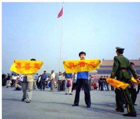
■ 天安门广场的法轮功横幅与警察暴力（摄于2001年5月13日）