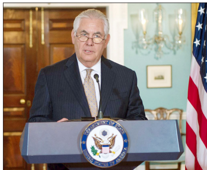
美国国务卿蒂勒森在新闻发布会上

【明慧网】美国国务院于2017年8月15日发布2016年《国际宗教自由报告》，关注全球信仰自由状况。中国与另九个国家因存在严重宗教迫害问题，被列为“特别关注国”。美国国务卿蒂勒森（Rex Tillerson）对中共迫害信仰人士的行径表示关注。他在新闻发布会上提到，2016年有数十名法轮功修炼者在被关押期间死亡。