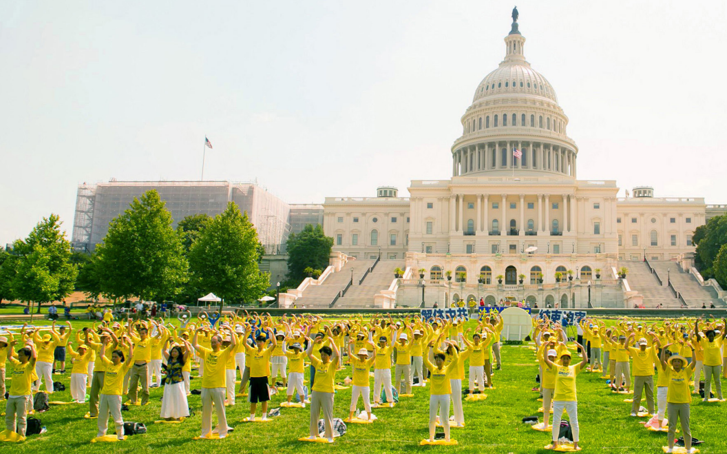
2017 年 7 月 20 日，美国首都华盛顿，国会山前，法轮功学员集体炼功。

18 年来，法轮功学员以善良与坚忍面对暴戾，维护着信仰的自由，说真话的权利，按“真善忍”做好人的权利。他们的和平与理性，穿透黑暗，也使越来越多的世人看到了曙光。国际宗教自由委员会委员斯维特博士 (Katrina Lantos Swett) 说：