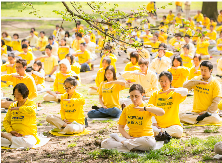
海外法轮功学员在公园里炼功