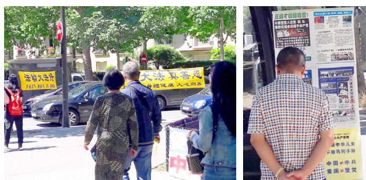
法国巴黎，游客经过法轮功真相点，了解真相。

2017年夏季，来法国巴黎旅游的中国大陆游客日渐增多。在巴黎的旅游景点，每天都有法轮功学员设立真相点，向同胞讲述中共迫害法轮功的真相，让游客带回国的不仅是名牌商品，还有“三退”（退党、退团、退队）后的平安与美好。