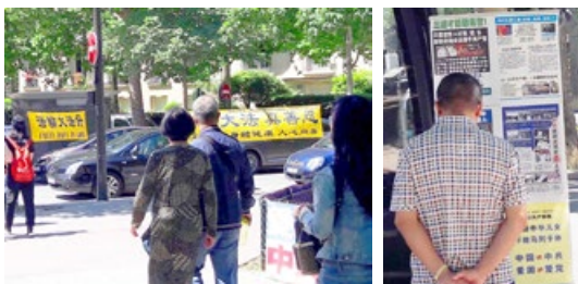
法国巴黎,游客经过法轮功真相点,了解真相。

2017年夏季,来法国巴黎旅游的中国大陆游客日渐增多。在巴黎的旅游景点,每天都有法轮功学员设立真相点,向同胞讲述中共迫害法轮功的真相,让游客带回国的不仅是名牌商品,还有“三退”(退党、退团、退队)后的平安与美好。