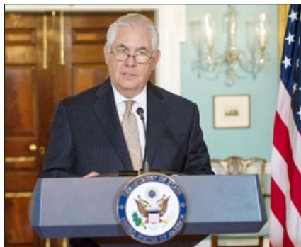
美国国务卿蒂勒森在新闻发布会上

【明慧网】美国国务院于 2017 年 8 月 15 日发布 2016 年《国际宗教自由报告》，关注全球信仰自由状况。中国与另九个国家因存在严重宗教迫害问题，被列为“特别关注国”。美国国务卿蒂勒森（Rex Tillerson）对中共迫害信仰人士的行径表示关注。他在新闻发布会上提到，2016 年有数十名法轮功修炼者在被关押期间死亡。