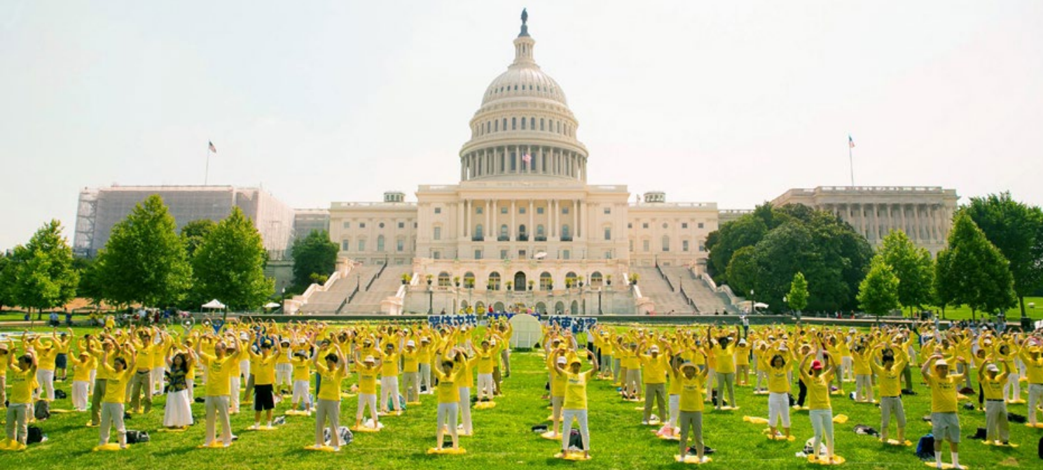
2017 年 7 月 20 日，美国首都华盛顿，国会山前，法轮功学员集体炼功。

“法轮功学员在被迫害中体现出尊严、善良和慈悲，甚至对迫害者同样报之以慈悲。他们为所有人树立了无与伦比的典范。”◇