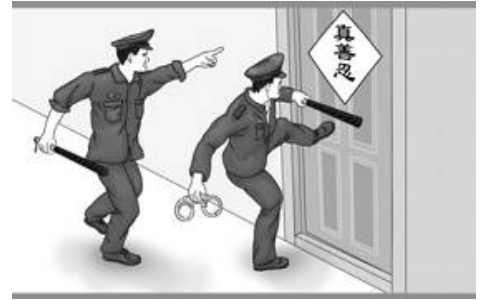
▲漫画：中共警察闯入民宅绑架法轮功学员

这些上门骚扰法轮功学员的人员，大多不听真相。有的听了法轮功真相后表示同情，也说知道李洪志先生是好人，法轮功是好功法，但我们