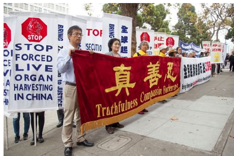
左图：旧金山湾区法轮功学员和支持者在中共驻旧金山中领馆前集会。

加州参议员乔尔·安德森在集会上说：SJR 10 决议案上周在参议院司法委员会获得通过。SJR 10 决议案是由加州参议员乔尔·安德森发起，另外两名民主党众议员和两名共和党众议员联署，其中包括加州众