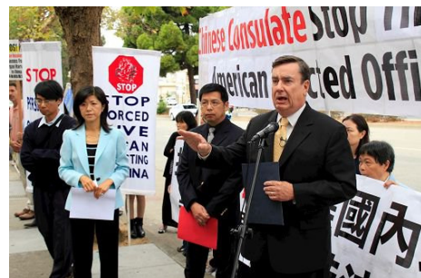
右图：加州参议员乔尔·安德森在集会上谴责中共对法轮功学员的迫害。