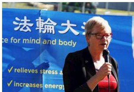
莱斯在法轮功学员集会现场演讲

员莱斯来到法轮功学员的集会现场，并发表演讲。她表示：“十年前，当我还是一个地方政府议员时，我就开始为法轮功的遭遇说话，反对中共对法轮功的迫害。只要迫害还在发生，我将自始至终，继续为（制止）中共