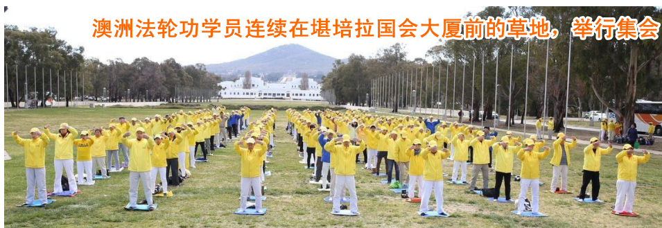
澳洲法轮功学员连续在堪培拉国会大厦前的草地，举行集会