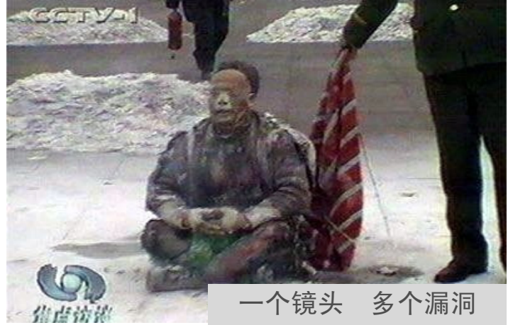
一个镜头 多个漏洞

上都是私心，修炼就是修去私心、提高道德的过程，是内心实实在在的净化和升华。在这个过程中，我渐渐体会到放下执著的轻松快乐，感受到内心的充实和平静。感恩师父让我们走入修炼。◇（文/大陆法轮功学员）