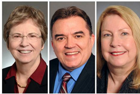
■明尼苏达州参议员（41 选区）凯洛琳·丽安，参议员（36 选区）约翰·霍夫曼，参议员（40 选区）克里斯·伊顿

丁俞国 1982 年生，上海浦东新区金桥人，从小品学兼优，个性敦厚。在中共对法轮功的迫害打压最严酷时期，他识破谎言，走入法轮大法的修炼，由原来的体弱多病变得健康有活力。