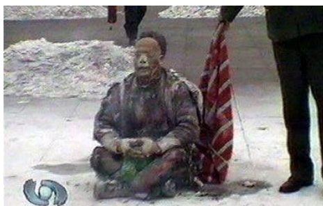
■图为中共栽赃嫁祸法轮功的“天安门自焚”伪案现场图片，“烧不破的雪碧瓶”、“头发烧不着”等等漏洞百出，国际社会已揭示：该事件是由中共政府一手导演的。

警察在所谓走访法轮功学员的过程中，他们亲身了解的情况，使他们自己对“敲门行动”表示反感和无奈，他们通常向法轮功学员表示，“证明一下我们来了，回去交差。”“是上边叫我们走访的，我们只是问问。”“好，就在家炼”等，他们主要是对中共的恐惧，怕受牵连丢饭碗。◇