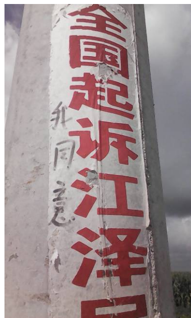
条幅上的民意：『我同意』

■青岛某地一条街道旁的一个电线杆子上贴着一个“全国起诉江泽民”的不干胶条幅，旁边有人写了三个大字“我同意”，表达了百姓的心声。