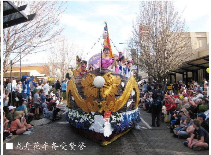
■ 龙舟花车备受赞誉