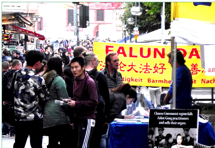
图：法轮功的展台前人流穿梭不息，有的前来询问并拿走资料，有的在反迫害的表上签名。

看国外消息，相对来讲思想比较开放。有的中国人听明白了就答应退出中共组织。一个商家的展台上有一位年轻人，一位女同事静静地听法轮功学员讲。临走前学员走到她跟前，悄悄问她是不是退出（党、团、队）来，她欣然点头，退出党员。还有的来参观的中国人听了真相后，爽快地答应退出来中共党、团、队组织，并感谢学员的努力。◇