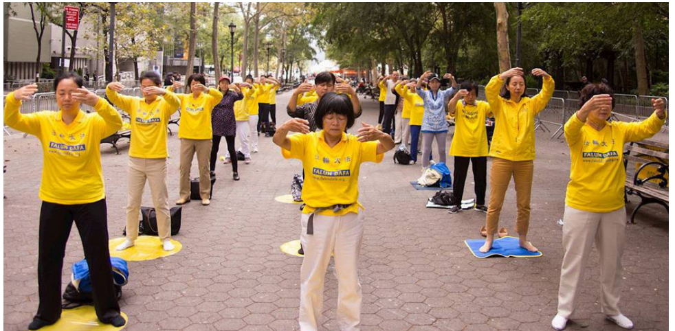
유엔 총회 기간인 2017년 9월 19일, 뉴욕 파룬궁 수련생들이 유엔본부 인근에서 평화 청원을 펼치며 중공의 파룬궁 박해 중지와 장쩌민 사법처리를 요구했다.

사는 말했다. “진(真), 선(善), 인(忍)에 대한 파룬따파 제자의 추구하고 믿음은 중국을 위해 평화를 가져올 수 있을 뿐 아니라 세계 국민을 위해 복지를 가져올 수 있습니다.”