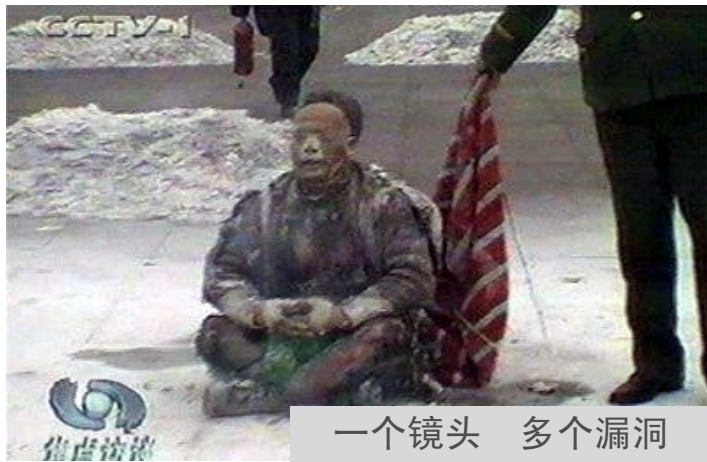
一个镜头 多个漏洞

上都是私心，修炼就是修去私心、提高道德的过程，是内心实实在在的净化和升华。在这个过程中，我渐渐体悟到放下执著的轻松快乐，感受到内心的充实和平静。感恩师父让我们走入修炼。◇（文/大陆法轮功学员）