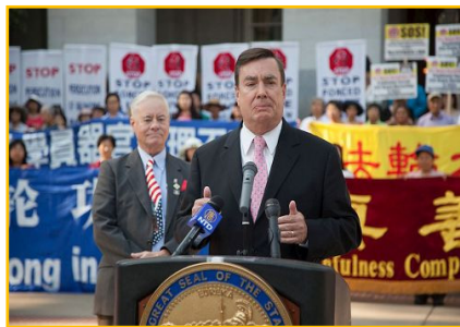
图：参议员安德森表示，迫害必须停止