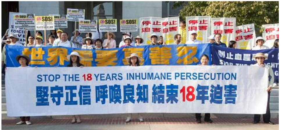
■ 法轮功学员在加州首府沙加缅度议会大厦前举行集会