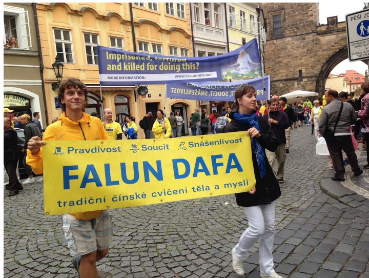
■ 法轮功游行队伍行进在布拉格街道

法轮功学员的游行队伍从瓦次拉夫广场出发，开始沿着布拉格最繁华、游客最多的街道和景点行进。捷克多家媒体，如捷通社，闪电，捷克周刊和宗教信息等，都对当天的布拉格集会游行的盛况进行了报道，并刊有多张照片。其中“宗教信息”媒体刊登了法轮功创始人李洪志先生的照片。