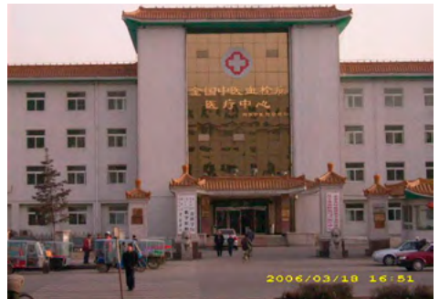
图：苏家屯血栓病医院北面正门

2006 年 3 月 17 日，《大纪元时报》报道，证人之二安妮 (ANNI) 出面指证，此秘密集中营就设在辽宁省血栓中西医结合医院的“地下医疗设施”里。她的前夫就是苏家屯集中营活体器官摘除主刀医生之一。他是脑外科医生，主要从事眼角膜摘取。她的医生丈夫亲自在法轮功学员仍活着情况下摘取器官，他们逃离医院时，6000 名被关押者只剩 2000 名。活体器官摘除和焚尸的惨烈，给证人