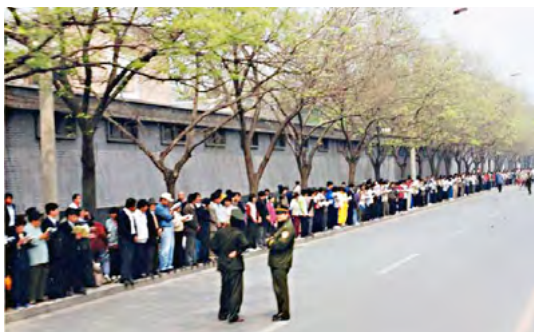
图：1999 年 4 月 25 日上访现场，法轮功学员文明安静，警察不用维持秩序，在一旁聊天。所谓的“围攻中南海”根本就不存在。

1999 年 4 月 25 日，上万名法轮功学员出现在中南海国务院信访办公室前，向当局和平请愿。史称“4·25”。当天中共中央军事委员会副主席张万年接到党魁兼军委主席江泽民的指示，要求全军特别是北京地区军队和武警部队反对法轮功的工作进行紧急动员部署。按照张万年的指示，总参谋部、总政治部立即下发紧急通知，要求全军迅速行动起来，查清军人及其家属子女、离退休老干部参加法轮功及其他类似组织的情况，并在全军范围内进行无神论洗脑式宣传。