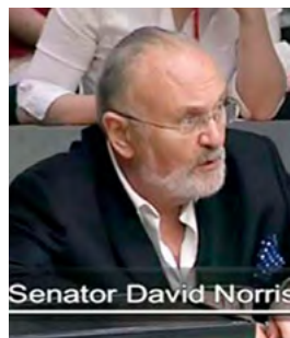
爱尔兰议会听证会

◆ 2013 年 7 月 10 日，爱尔兰议会外交事务及贸易联合委员会举行了关于阻止中共活摘器官的听证会，加拿大人权律师大卫·麦塔斯和美国作家伊森·葛特曼运用大量调查数据和事实资料得出结论，2000 年至 2005 年间，至少有六万五千多名法轮功学员被中共活摘器官，而实际上被虐杀的法轮功学员可能超过上百万，与会议员对这一事实表示极大震惊。