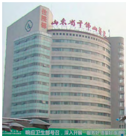
图：山东省千佛山医院

2006 年 4 月 14 日，一位在济南医疗系统工作长达 20 多年，因对罪恶保持沉默而良心备受煎熬的知情人投书海外媒体，披露了其所知道的事实：位于济南市的山东省千佛山医院、山东省警官总医院、山东省监狱、山东省女子监狱（位于工业南路上，对外挂的牌子是“山东省兴业发展有限公司”）及更多的监狱、劳教所共同勾结，形成了从被关押的法轮功学员活体器官库的建立维持、器官移植市场及中介，到活体器官摘除、移植、实验及利益分赃等环节的完整的“一条龙杀人产业”。这两家医院都直接得到中央一级的明确指示，由院方全力组织直接参与活体摘取法轮功学员的器官，活体器官移植采用了“流水”作业。