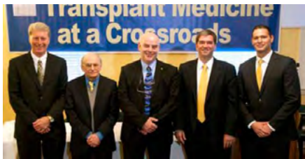
国际组织“医生反对强摘器官”

◆ 2013 年 12 月 10 日国际人权日当天，国际组织“医生反对强摘器官（DAFOH）”在瑞士日内瓦举行新闻发布会，他们已经把全球五大洲、五十三个国家和地区近一百五十万人的联署签名请愿信送