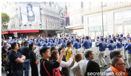
中国游客看法轮功游行