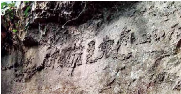
巨石断面惊现“中國共產党亡”六个大字

这是上天在警示世人,警示中国人,中共即将遭到天谴。神是慈悲于人的,就用“三退”(退出中共党团组织)的方式让人与中共脱离干系,以免在天灭中共的劫难中受其牵连。现在,人们正纷纷加入全球退党大潮,目前有2.9亿中国人已经声明“三退”,为自己选择了美好的未来。◇