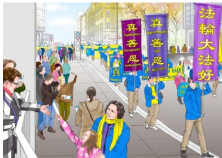
参加慕尼黑大游行

中，为了追赶队伍，妈妈居然跑了起来。伊莉惊讶地喊：“我妈妈能跑了，我妈妈能跑了！”