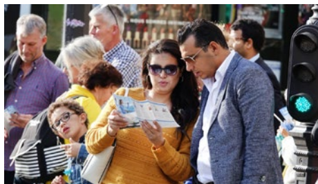
巴黎民众在阅读真相传单