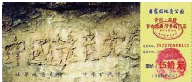
藏字石风景区门票