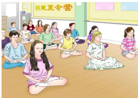
参加英国明慧夏令营