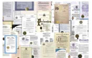
◎ 法轮大法获各国各界褒奖、支持议案与支持信函3500多项。

1999年10月25日江泽民在接受法国《费加罗时报》记者采访时第一次提出“法轮功就是X教”的说法。第二天，《人民日报》便发表了同样标题的社论。需要说明的是江泽民的讲话和《人民日报》的社论不是法律，不具有任何法律效力，反而是一种违法行为。