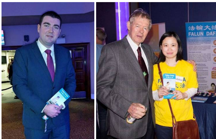
■上图：爱尔兰欧盟议员肖恩·凯里与法轮功学员合影留念。左下：爱尔兰体育部副部长布伦丹·格里芬；右下：爱尔兰家喻户晓的体育解说员米浩·奥莫瑞哈提

奥莫瑞哈提先生来到法轮功学员的展位，他告诉法轮功学员他和女儿去德国时碰到过法轮功（学员）：“我知道法轮功，我和女儿在德国的勃兰登堡门看到过法轮功学员表演。”最后奥莫瑞哈提先生在制止迫害征签表上签了名。