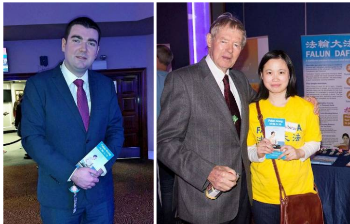
■上图：爱尔兰欧盟议员肖恩·凯里与法轮功学员合影留念。左下：爱尔兰体育部副部长布伦丹·格里芬；右下：爱尔兰家喻户晓的体育解说员米浩·奥莫瑞哈提

奥莫瑞哈提先生来到法轮功学员的展位，他告诉法轮功学员他和女儿去德国时碰到过法轮功（学员）：“我知道法轮功，我和女儿在德国的勃兰登堡门看到过法轮功学员表演。”最后奥莫瑞哈提先生在制止迫害征签表上签了名。