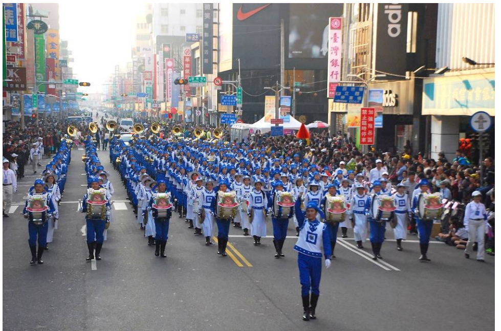
■参加国际管乐节踩街活动的台湾天国乐团

中山路是嘉义市商业荟萃的中心。乐团从中山路迈开脚步，奏出《法轮大法好》乐曲时，雄壮音乐震撼整条街道，吸引了民众的目光，沿路万人空巷，围观的群众望着天国乐团惊呼说：“这是最壮观的乐团。”