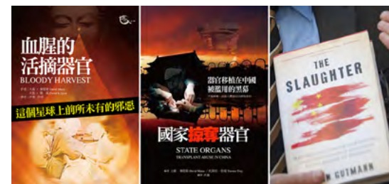
图：国际社会经过严谨的调查取证，出版：《血腥的活摘器官》、《国家掠夺器官》和《屠杀》（或译成《大屠杀》）三本书，详尽地证实了中共活摘法轮功学员器官贩卖的事实。