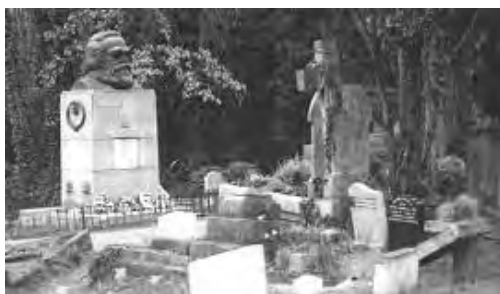
图：马克思死后埋在英国伦敦的高门墓地（Highgate Cemetery，大陆译为“海格特公墓”）。高门墓地是伦敦地区的撒旦崇拜中心，许多崇拜魔鬼的黑色仪式在这个墓地举行。