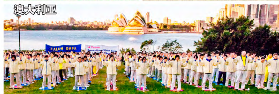
■ 法轮功已弘传世界一百多个国家和地区