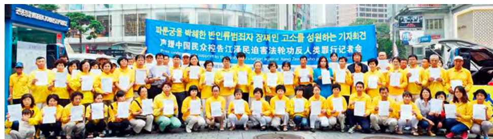
图：2015 年 7 月 13 日，韩国法轮功学员在中共驻韩大使馆前声援中国民众控告江泽民。韩国已有至少 116 名法轮功学员向中国最高检察院、最高法院邮寄了控告江泽民的“刑事控告状”。

2015 年 5 月 1 日，中国最高法院发布了“有案必立，有诉必理”的通告后，至今国内已有超过二十多万法轮功学员及家属向最高检察院和最高法院实名控告江泽民（从 2015 年 5 月底到 2016 年 10 月 25 日，明慧网已收到总数 209908 名法轮功学员及家属递交给中国最高检察院、法院的实名诉讼状副本。），提请最高检察院追究江泽民在迫害法轮功的责任中所犯下的罪恶，追究江泽民的刑事责任。