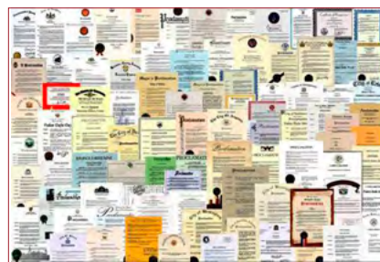
▲ 来自世界各国的部分褒奖。