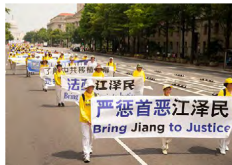
图：2017 年 7 月 20 日法轮功学员在美国首都华盛顿大游行。