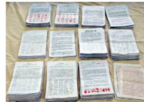
图：河北唐山 45193 人签名举报江泽民。

“全球声援中国民众控告江泽民的刑事举报联署活动”从 2015 年 7 月开始到 2017 年 12 月 8 日，已获得亚洲台湾、韩国、日本、港澳、新加坡、马来西亚、印尼共七个国家和地区，及欧洲 24 个国家，合计共 31 个国家及地区，超过 260 万（2,602,650）民众联署向中国最高法院和最高检察院举报江泽民。其中以台湾 92 万（926,286）人、韩国 67 万（671,422）人和日本 48 万（483,360）人为最多。