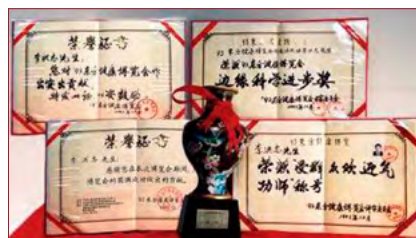
▲ 1993 年北京东方健康博览会上，李洪志先生荣获博览会最高奖项“边缘科学进步奖”。

● 弘传世界 法轮大法已弘传世界一百多个国家和地区，受到世界人民的爱戴和尊敬。因为李洪志先生和法轮大法对人类身心健康做出的杰出贡献，获各国政府褒奖、支持议案和信函 3500 多项。