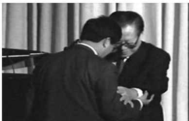
图：2002 年 10 月，江泽民以私人身份访美时，被法轮功学员在芝加哥以群体灭绝罪、酷刑罪、反人类罪告上法庭，江泽民接到控告状时惊慌失措。

◆ 2012 年 10 月 30 日“清算江泽民迫害法轮大法国际组织”发布成立公告，将开始彻底清算江泽民流氓集团、“六一零办公室”以及直接实行迫害的公、检、法组织和在劳教所、洗脑班、监狱的管教人员与恶警，以及丧尽天良的活摘法轮功学员器官的所谓医生等。