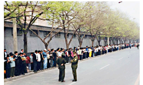
图：1999 年 4 月 25 日上访现场，法轮功学员文明安静，警察不用维持秩序，在一旁聊天。所谓的“围攻中南海”根本就不存在。