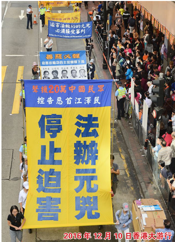
2016年12月10日香港大游行