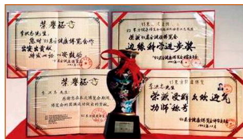
▲ 1993 年北京东方健康博览会上，李洪志先生荣获博览会最高奖项“边缘科学进步奖”。

“真、善、忍”的信仰得到了世界各族裔民众的爱戴和尊敬，却在中國大陸一地受到残酷迫害。