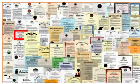
▲ 法轮功获各国政府褒奖、支持议案和信函 3500 多项。上图是来自世界各国的部分褒奖。